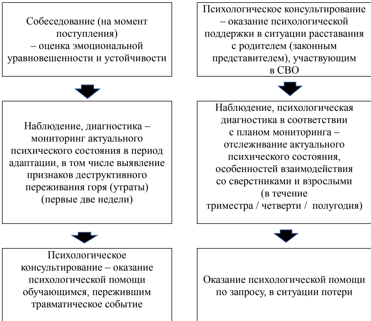
Схема выстраивания работы педагогов-психологов / психологов по психологическому сопровождению детей ветеранов (участников) СВО в зависимости от статуса пребывания обучающегося в образовательной организации

Каждое направление деятельности педагога-психолога / психолога включается в единый процесс сопровождения, обретая свою специфику, конкретное содержательное наполнение в форме программ адресной помощи (далее – психолого-педагогические программы) с учетом выявленных психолого-педагогических проблем, рисков и трудностей обучающихся целевой группы.